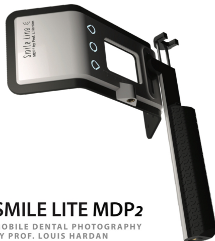
SMILE LITE MDP2 MOBILE DENTAL PHOTOGRAPHY BY PROF. LOUIS HARDAN