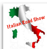
Foto con filtro Style Lense